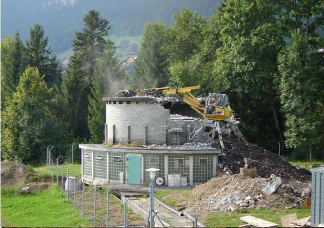
Abbruch des in Zukunft überflüssigen Rundbaus