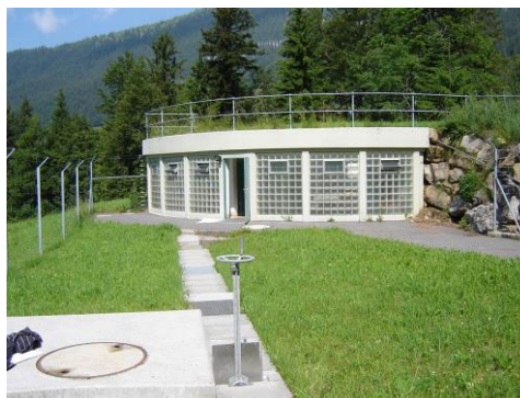
Nach dem Umbau